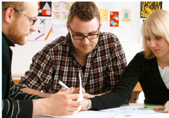
Schüler in der Konzeptionsphase einer Gruppenarbeit im Lernfeldunterricht, 3. Ausbildungsjahr