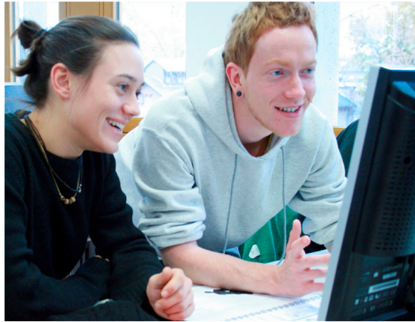
Schüler im Fachpraxisunterricht: Datenverarbeitung/Präsentationstechnik

Inhaltliche und methodische Kenntnisse intensivieren (Vorbereitung der Fachhochschulreifeprüfung). Soft Skills ausbilden, z.B. Teamfähigkeit. Vertiefen der Englischkenntnisse und der unternehmerischen Kompetenzen durch einen (optionalen) 4-wöchigen Aufenthalt am Manchester College, unserer Partnerschule.